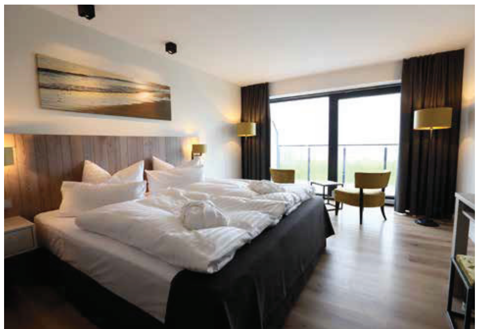
▲ Zimmer Elstrand Resort / Guest room at Elstrand Resort

für das Rundum-Wohlfühlgefühl eines Hauses. An der Rezeption kann Musik einen positiven Eindruck verstärken. Sie bewirkt auch ein sogenanntes „Soundmasking“ und sorgt dafür, dass andere Gäste nicht hören können, was direkt vor ihnen an der Empfangstheke gesprochen wird.